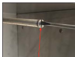
Tightening the End-Caps