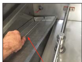
Quitar el cedazo