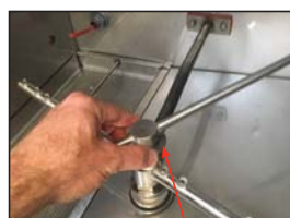
Desatornillar los brazos de lavar y enjuagar