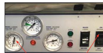
Wash Temperature Gauge "ON/OFF" Switch