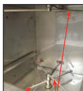
Wash and Rinse Arms