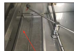
Limpiar el cedazo