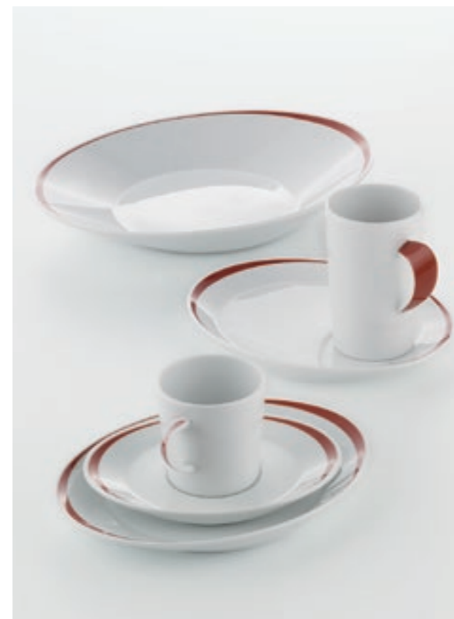
DECOR PATTERN EXPERIENCE 62867