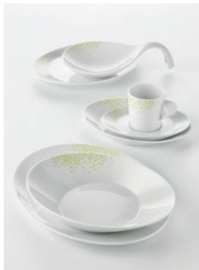
DECOR PATTERN JUST NATURE 63093