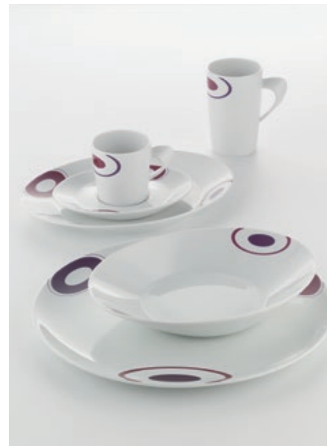
DECOR PATTERN TOMORROW 62865

SIGNATURE cautiva por su óptica a la vez de nobleza intemporal y clara modernidad. Los diferentes conceptos de decoraciones tienen un acento divertido y encantador, con dibujos y colores que respetan la sobriedad del diseño. Superficies y líneas asimétricas proporcionan a las piezas de porcelana su nota individual, logrando una conexión emocional hacia una nueva creatividad a la hora de presentar sus comidas. Las decoraciones SIGNATURE sorprenden por sus colores y tonalidades intensas, aportando acentos fascinantes.