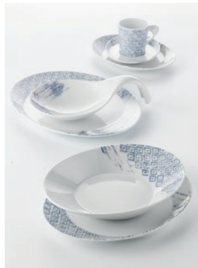
DECOR PATTERN STONEWASHED 63094