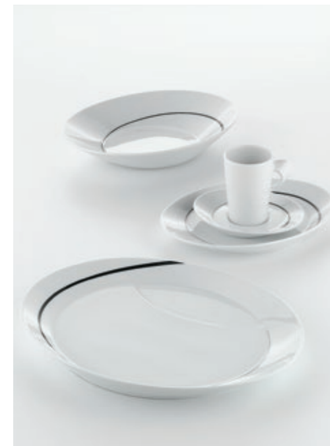
DECOR PATTERN IDENTITY 62866