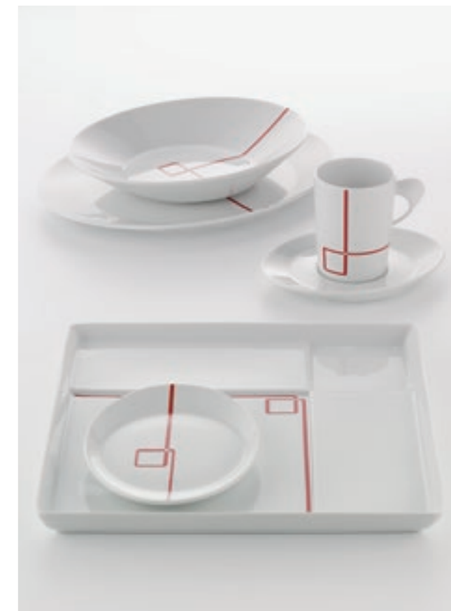
DECOR PATTERN GUIDE LINE 62864